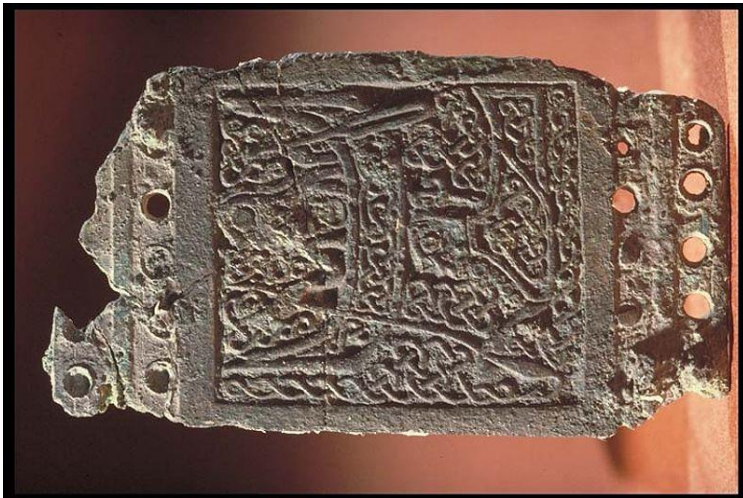
Bältesspännen från Solberga 600-900-tal

Författaren bekräftar och förstärker i noggrann analys av ett omfattande, skadat material tidigare forskningar att den var en stormannagrav. Inventeringslistan ger syn för sägen: ”1 rektangulärt beslag av brons med figurframställning av en fiskare och sjötroll, 1 remsölja med djuornamentik, 8 fragmentariska remseslag av brons med djuornamentik, 2 remseslag av järn, 10 hela och 24 fragment av enkla nitar av järn med stora platta huvuden, järnstift, 39-tal bitar av två glaspägare och ca 14 spelbrickor av ben samt drygt 20 liter brända ben, föremål som med säkerhet tillhört en person med hög dignitet.